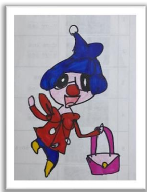
←小学6年生女子Aさんが描いてくれた作品です。 「ポンチョを着たマネネ」

皆さんの作品や投稿を見ることで、「自分もやってみよう！」と思って余暇を広げるきっかけになるといいですね。どしどしご応募ください！！