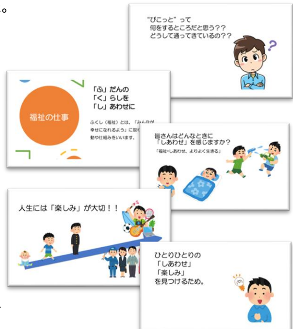
↑オリエンテーションで使用した資料の一部です。

なかなか、考えたことがないテーマでしたが、問いかけをすることで、少しでも自分の「しあわせ」について考えるきっかけになったのではないかと思います。